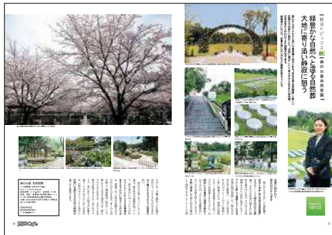
【新しいお墓のかたち】