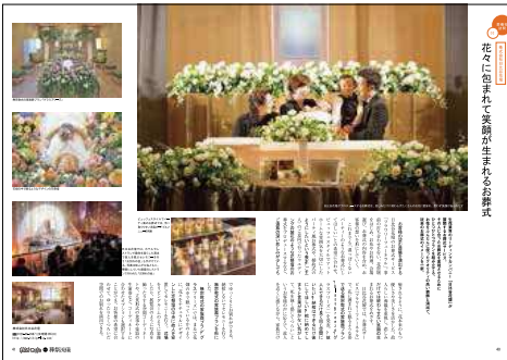
【「家族葬」完全ガイド】