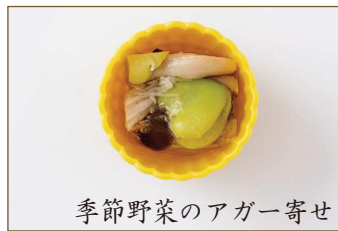
季節野菜のアガー寄せ

精進料理では肉や魚をいただきます。そこで誕生したのが“もどき料理”。お寺でも使ってよい素材で作った、肉や魚に似せた料理です。その仕上がりの素晴らしさと味をどうぞ堪能下さい。