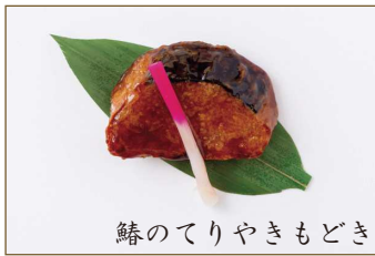
鯖のてりやきもどき

精進料理では肉や魚をいただきます。そこで誕生したのが“もどき料理”。お寺でも使ってよい素材で作った、肉や魚に似せた料理です。その仕上がりの素晴らしさと味をどうぞ堪能下さい。